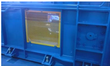
本体点検窓（スイッチ付） カバーを外すと機械が 全停止します

安全カバーは、「危険箇所」に装備しています したがって 勝手に取り外したりしてはいけません 点検・修理・清掃等を行う時は、必ず機械を停止し キースイッチを抜いてから行ってください