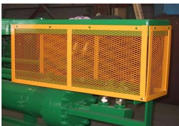
メインシリンダリミットカバー