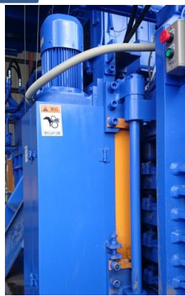
結束機爪部 安全カバー