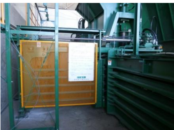
インサータ安全カバー