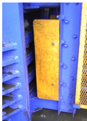
インサータサオ 先端部安全カバー