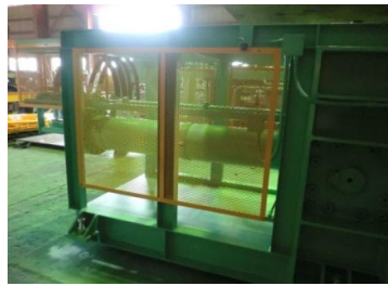
メインスイッチ安全カバー （スイッチ付） カバーを外すと機械が 全停止します