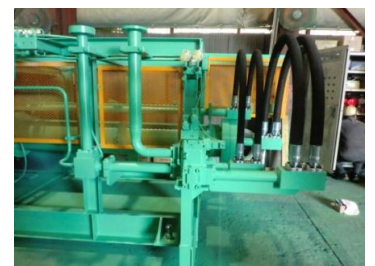
バルブ側安全カバー