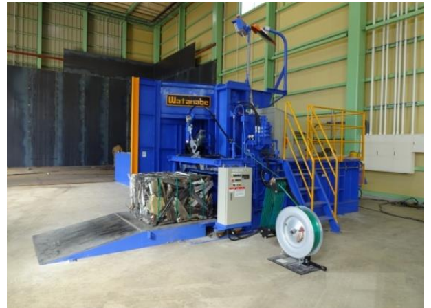
樹脂バンド結束機